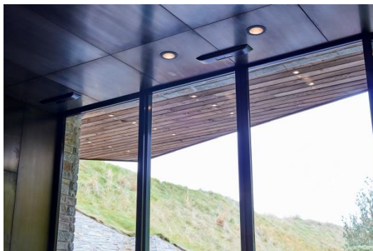
Diskretus sprendimas: GEZE durų automatika integruota į durų rėmą.