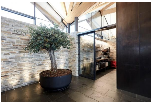
„Great Northern“ visi elementai yra visiškai suderinti vienas su kitu – nuo akmeninių sienų ir medinių dailiųjų iki stumdomų stiklinių durų su diskretiška GEZE durų sistemomis.