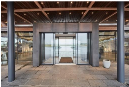
GEZE integruota visiškai stiklinių įėjimo durų sistema IGG.

„Great Northern“ pastatai atskleidžia naują estetinę erdvę su stilinga Šiaurės šalių, tačiau ir tarptautinį pojūtį suteikiančia architektūra: rankomis kalto graikišku smiltainiu bei mediena iš Afrikos. Medžiagų, tokių kaip lengvas kalkakmenis, tamsi mediena, šiltas varis ir stiklas, pasirinkimas paryškina gryną ir natūralią gamtos, supančios „Great Northern“, išraišką.