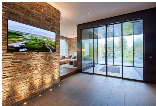
Šiltas sutikimas: GEZE durų sistemos laukiami svečiai Didžiojoje Šiaurėje Danijoje.

Be to, GEZE pateikė automatinis durų atidarytuvus su integruotomis asmenų saugos funkcijomis, skirtus techninėms patalpoms bei darbuotojų įėjimui į spa.